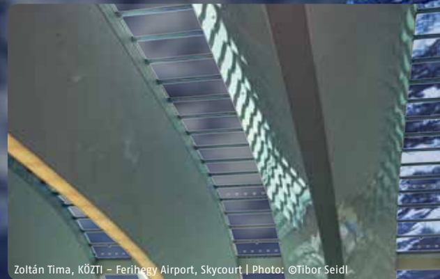
Zoltán Tima, KÖZTI - Ferihegy Airport, Skycourt